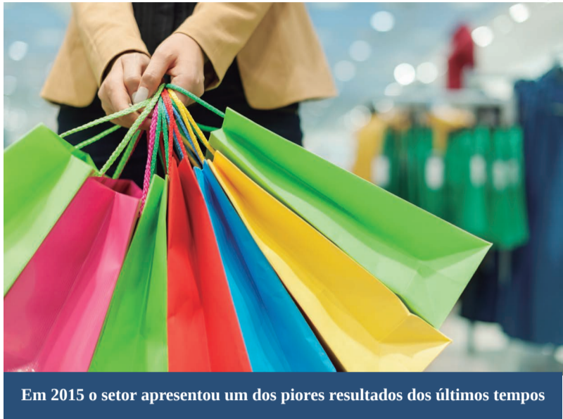
Em 2015 o setor apresentou um dos piores resultados dos últimos tempos

O varejo é dinâmico e quem não for capaz de se reinventar e acompanhar as tendências, principalmente em cenário de crise, ficará para trás