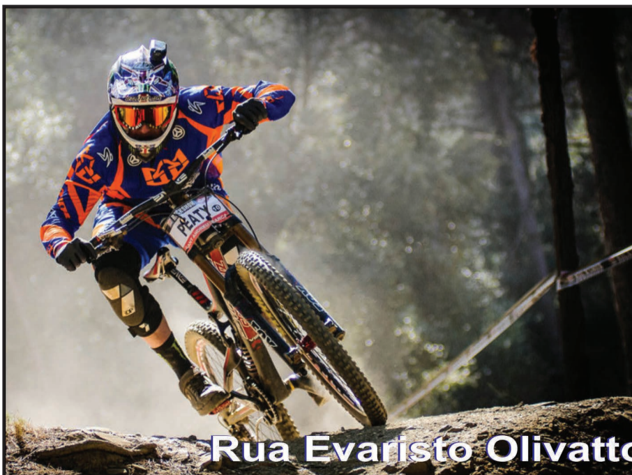
O Limeira Bike Clube organiza pedaladas dentro da área urbana e rural