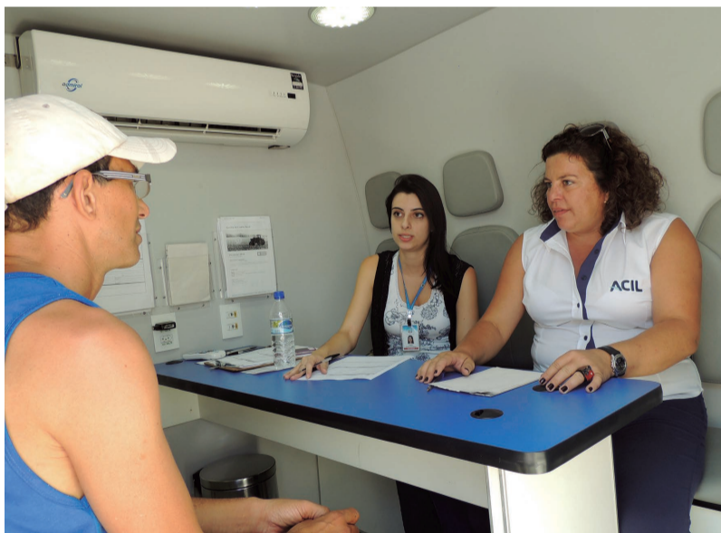
O Sebrae Móvel tirou dúvidas e deu informações para os empresários e potenciais empreendedores que visitaram o ACIL Itinerante

ACIL e todos os envolvidos na organização do movimento. Foram recebidas várias dicas que serão levadas em consideração, tanto em relação ao ACIL Itinerante quanto ao planejamento de todas as próximas ações. Com a receptividade do público, é um sinal verde para futuras edições do evento em novos corredores comerciais.