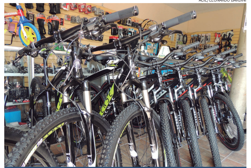
Existem vários modelos de bicicletas e peças para aqueles que desejam iniciar na pedalada

Milena já participou de diversos campeonatos do esporte, mas aquele que mais marcou