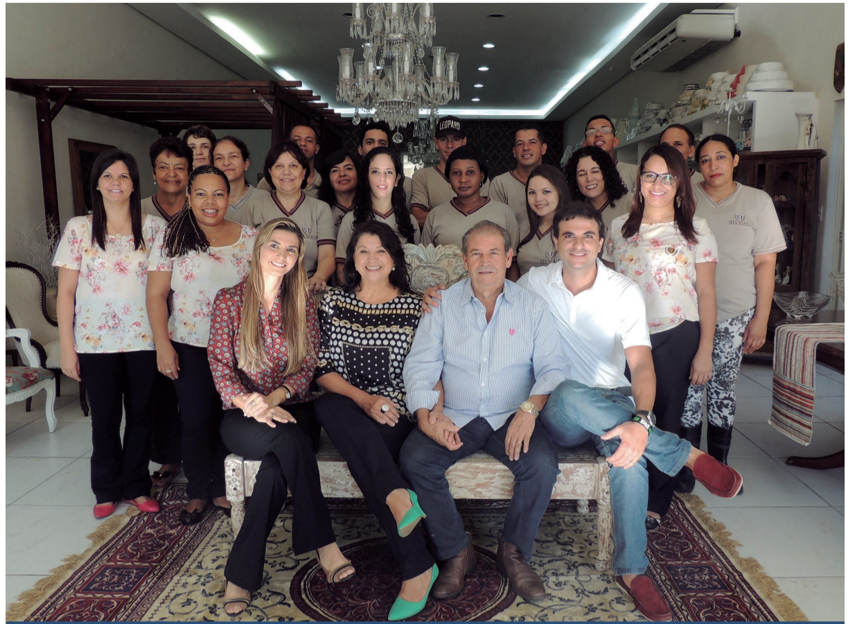
Além de excelente administração, é a equipe engajada e capacitada da Silva’s Festas que contribui para o sucesso da empresa

“Nosso prazer é poder colaborar na produção dos eventos