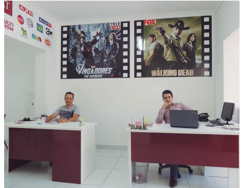
A equipe de colaboradores da Império Sat prioriza a satisfação do cliente